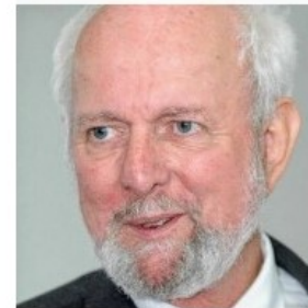
Mutmacher: Prof. Dr. E. U. v. Weizsäcker , Environment-, Climate-, Energy-Policies