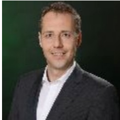
Arne Sigmund, Oberbürgermeister Stadt Zschopau