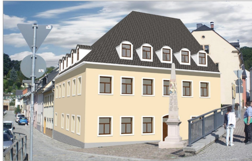
Szenario Sanierung des Gebäudes